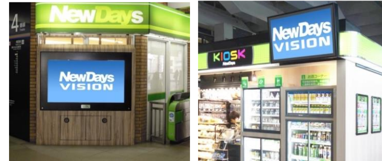
放映媒体イメージ(横型、音活用可能)