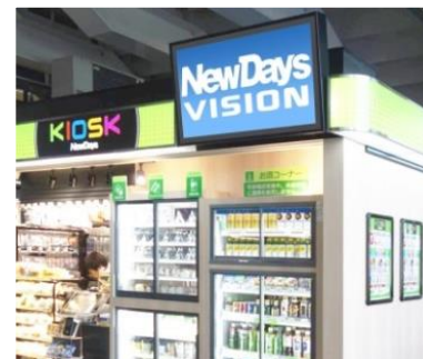
放映媒体イメージ(横型、音活用可能)