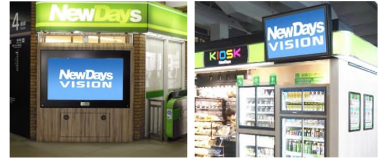
放映媒体イメージ